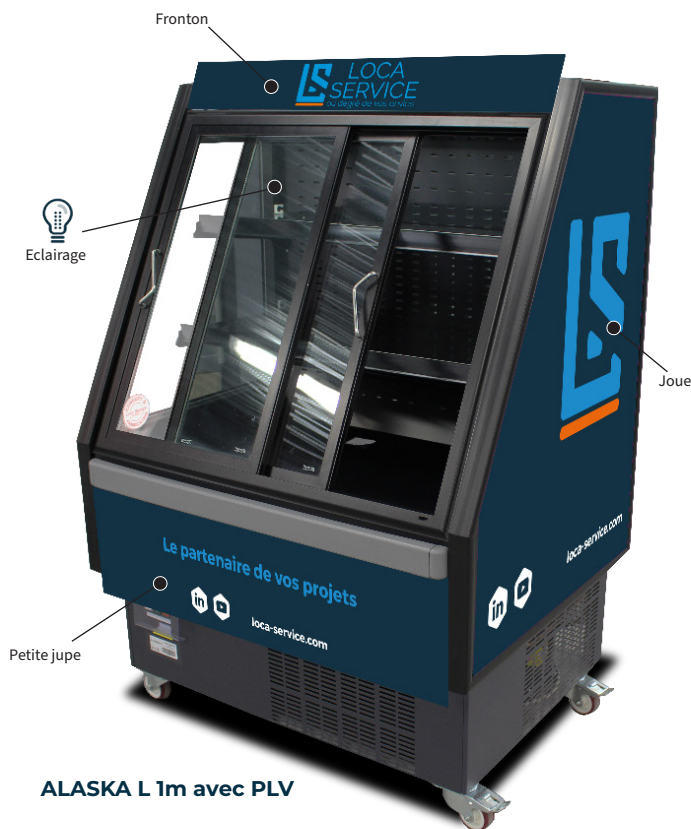
ALASKA L 1m avec PLV