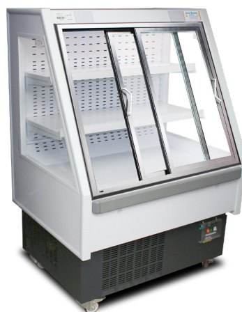
Visuel sans PLV Ref. : AL10HL