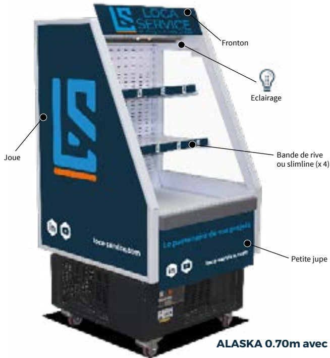
ALASKA 0.70m avec PLV