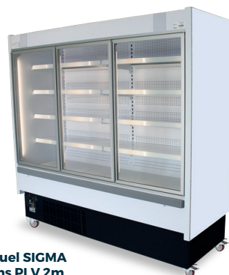
Visuel SIGMA sans PLV 2m Ref. : SI20