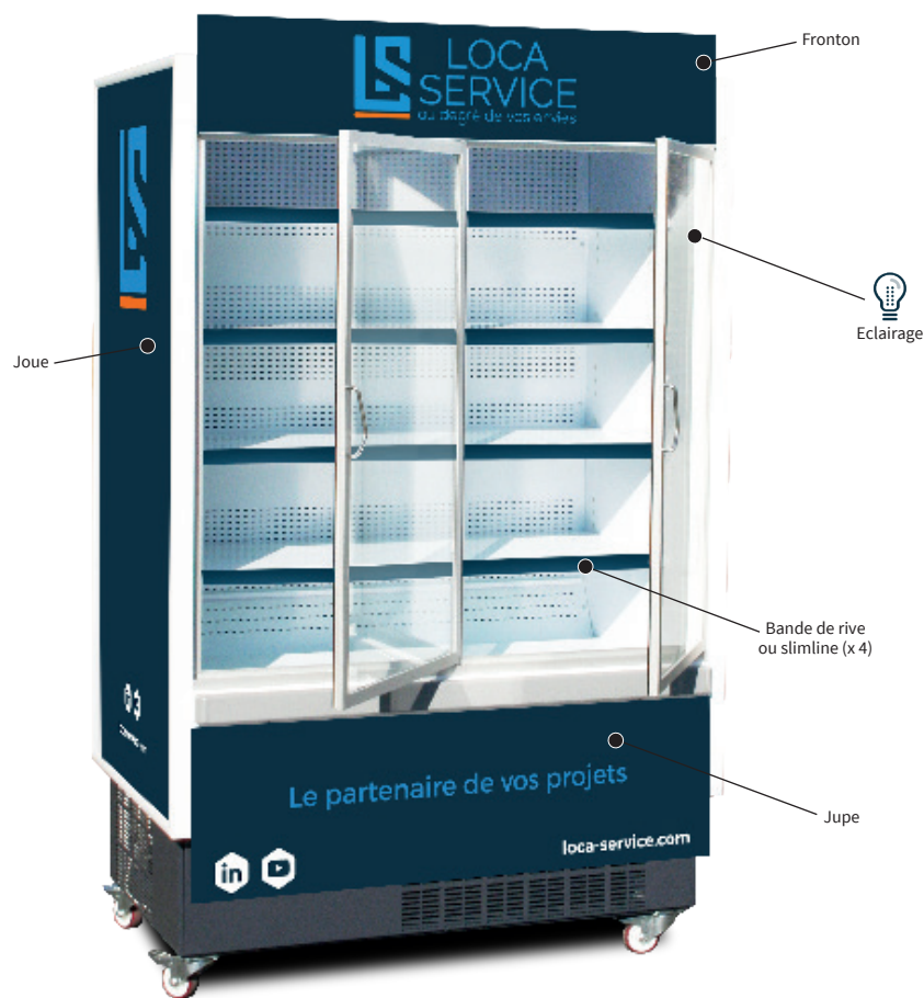
SIGMA 1.30m avec PLV