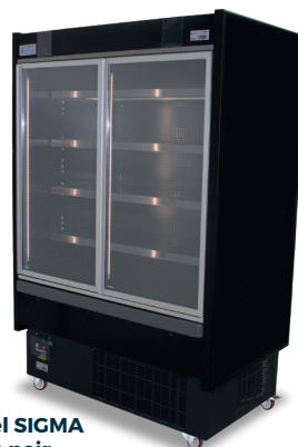
Visuel SIGMA en noir Ref. : SI13NN