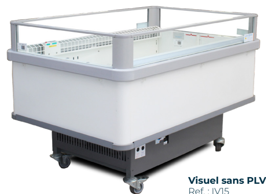
Visuel sans PLV Ref. : IV15